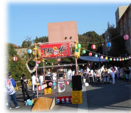
ゲームには長い列が出来ていました。

お祭りの締め括りは、下総病院名物のやぐらを囲んだ盆踊りです。患者さんと職員が一緒になって踊り、車椅子の患者さんもたくさん参加され、賑やかな一時になりました。会場は、終始楽しそうな笑顔が溢れていました。毎年天候が心配されますが、当日は空が抜けるような青空となり、最高の秋祭り日和でした！