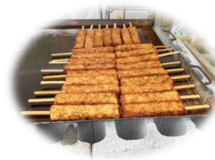
患者さんに人気 No.1 のお好み焼き棒

10月30日に秋祭りを開催しました！今年も、患者さんが毎年楽しみにしている食べ物とゲームの屋台が出され、カラオケ大会も行いました。屋台では、お好み焼き棒、フライドポテト、コーヒーゼリーを用意しました。患者さんは「ピクニックみたいで楽しかった。」と、晴天の下での食事は格別だったようです。