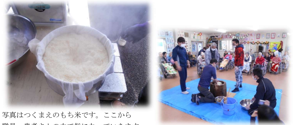
写真はつくまえのもち米です。ここから職員・患者さんの力で餅になっていきます。

つきあがった餅から大きな鏡餅を作り、お正月には事務所の窓口に飾られました。今年一年、円満に年を重ねられるようお願いが込められています。